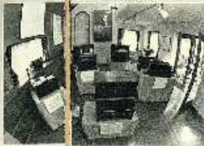
本誌「オルゴール」の制作現場。写真は、メロディを再現するためのメカニカルな構造を調整している様子。