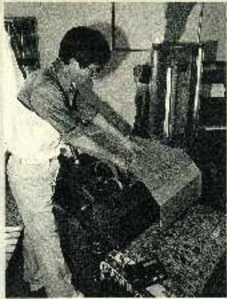
本誌「オルゴール」の制作現場。写真は、メロディを再現するためのメカニカルな構造を調整している様子。