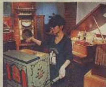
アンティークオルゴールの演奏も「東京・目黒の「オルゴールの小さな博物館」で」