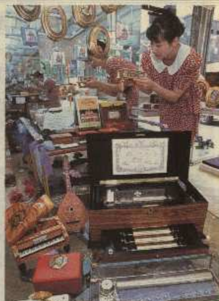
集めるだけでも楽しいオルゴール専門店「リユージュー・ミュージック・ブティック」